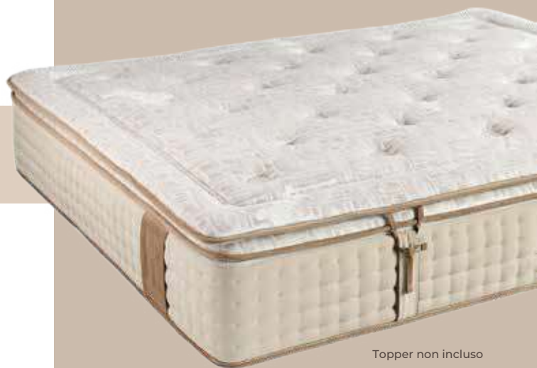
Topper non incluso